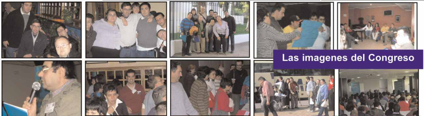
Las imágenes del Congreso